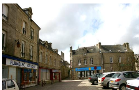
Bourg de Plumelec