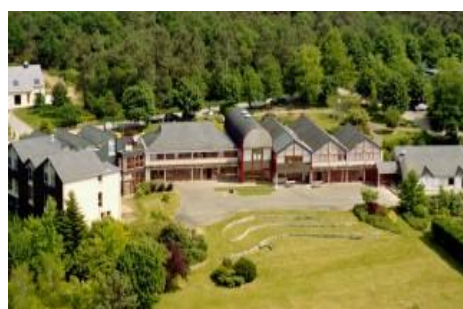
Lycée agricole à St Jean Brévelay