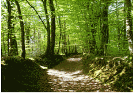
Landes de Lanvaux