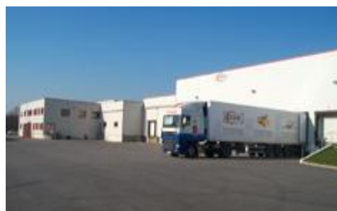
Entreprise Celvia (St Jean-Brévelay)

En plus de l' axe nord-sud (RD 767 Pontivy – Vannes) qui longe le territoire à l' est, la RN 24 assure un accès rapide sur l' axe Rennes - Lorient (programme Triskell). Cette route traverse deux communes au nord du canton (Saint Allouestre et Buléon). La desserte des communes du canton est assurée par plusieurs petites routes départementales, mais sans converger dans un point central du canton. Aucune liaison de transport public n' existe vers les polarités du Pays de Pontivy. Seule une ligne de bus (ligne 11) circule de Saint Jean-Brévelay vers Vannes ainsi qu' une ligne TER vers Rennes.