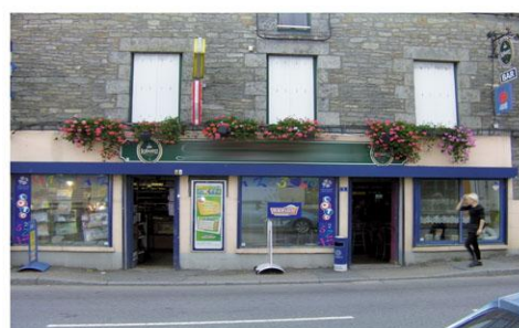
Commerces à St Jean Brévelay