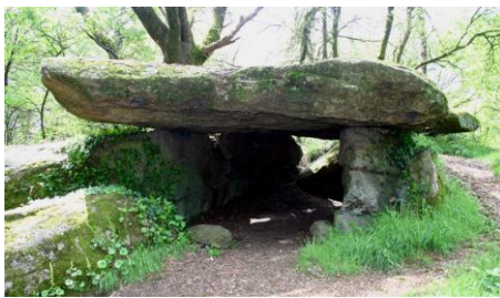
Allée couverte de Bospenn (St Jean Brévelay)

Le canton de Saint Jean est rattaché au Pays touristique de l'Oust à Brocéliande. Son office de tourisme est associé au canton de Locminé. Ces territoires n' ont pas d' attrait touristique réel, seule la commune de Guéhenno, labellisé « Patrimoine Rural de Bretagne » est un site visité. Quelques circuits de randonnées sont proposés par plusieurs communes. (randobreizh, chemins de randonnée à cheval). En contrepartie, le canton est fortement fréquenté par les cyclistes (vélo de course). L' offre d' hébergement est faible et essentiellement formée par des gîtes.