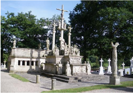
Calvaire de Guéhenno

Au sud du canton on trouve le paysage boisé et vallonné des Landes de Lanvaux (classées en ZNIEFF de type 2) et de la Vallée de la Claie. Tandis qu' au nord-est, on observe le piémont de Locminé où l' agriculture extensive (notamment de volaille) à un impact fort : présence de vastes champs, bâtiments d' élevage et usines agroalimentaires.