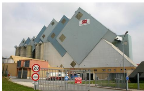
Usine agroalimentaire CECAB (St Allouestre)