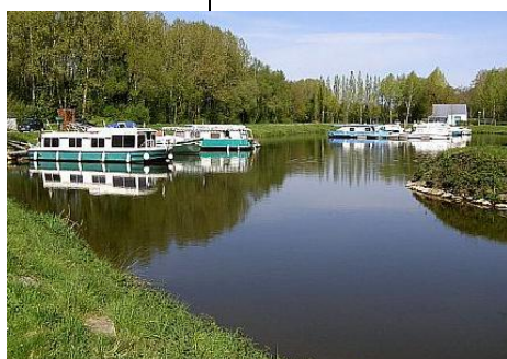
Le port de Rohan

Au-delà du centre bourg de Rohan et du canal, quelques projets (menés notamment par Pontivy Communauté) sont néanmoins en cours pour amener le visiteur à l'intérieur des terres : l'installation d'aire de stationnement et de service pour les camping-cars, des itinéraires vélos, des chemins de promenade, la valorisation de l'ancienne ligne ferroviaire comme corridor écologique. D'ores et déjà, la commune de Réguiny accueille les visiteurs dans son camping et sa piscine (station verte, possibilité de faire du golf et de la pêche). A noter le projet de la commune de Radenac de développer dans les prochaines années ces circuits en