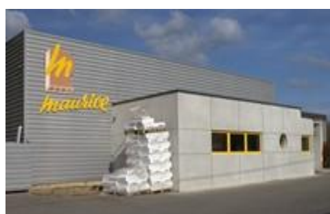
Entreprise artisanale (Rohan)

lien avec les expositions de célèbres cyclistes bretons notamment Jean Robic.