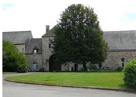
Abbaye de Notre-Dame de Timadeuc (Bréhan)

Il reste du passage de la famille de Rohan le nom donné à la commune, chef-lieu de canton et la présence du château fondé en 1104 en état de ruine. Quelques édifices sont à visiter dans les alentours, notamment l'Abbaye de Notre-Dame de Timadeuc à Bréhan très fréquentée.