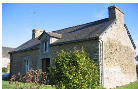
Bâti ancien rénové (Radenac)