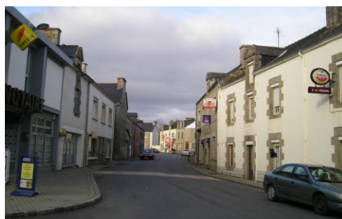
Rue principale du bourg (Réguigny)