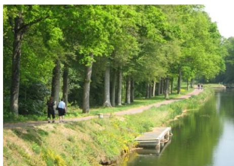
Chemin de halage du canal

Le canal de Nantes à Brest, l'Oust et la Belle Chère ont creusé leur lit dans ce plateau pour créer un autre paysage, plus intime et renfermé, principale attraction touristique du canton.