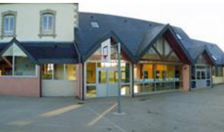
Ecole élémentaire de St Thuriau