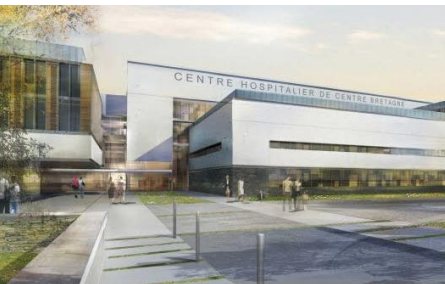
Futur centre hospitalier (Noyal-Pontivy)