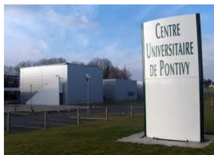
Centre universitaire de Pontivy

Pontivy est l'héritière d'une très ancienne tradition commerciale. La vieille ville a d'ailleurs conservé dans la trame de ses rues et de ses places la mémoire des halles et marchés disparus. Aujourd'hui, elle compte près de quatre cent commerces, dont une quarantaine de grandes surfaces, répartis principalement entre trois pôles d'activité : le centre ville, Pontivy Sud et Saint-Niel. Pontivy regroupe ainsi 33% de l'offre traditionnelle du Pays, 59% en équipement de la personne et 56% en équipement de la maison. Avec un tissu commercial et artisanal en croissance, elle attire des commerces attractifs et de nombreuses entreprises. Pontivy a donc un rôle moteur pour l'ensemble de la communauté de communes et le pays, avec une zone de chalandise qui déborde sur une partie des Côtes d'Armor. Toutefois, les flux automobiles et la difficulté d'adaptation urbaine du centre ville, sont au détriment de l'ambiance et de l'attractivité commerciale.