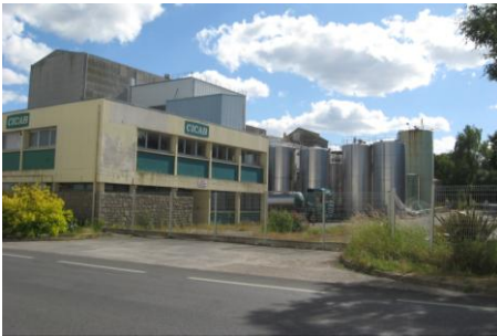
Entreprise agroalimentaire (Pontivy)