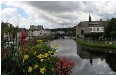
Le Blavet à Pontivy