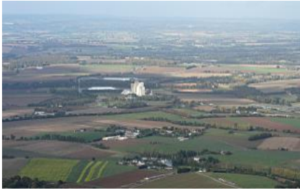
Paysage de la commune de St Gérard