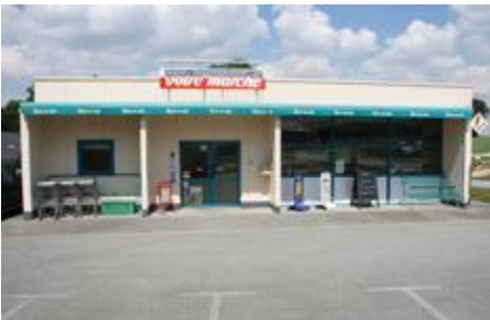
Epicierie (St Thuriau)