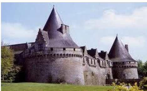
Château de Pontivy