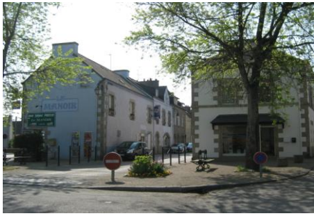
Centre ville de Noyal Pontivy