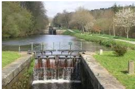
L'échelle d'écluses de Boju (Gueltas) 23 écluses sur 4 km