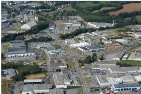
Parc d'activité de Pontivy Sud