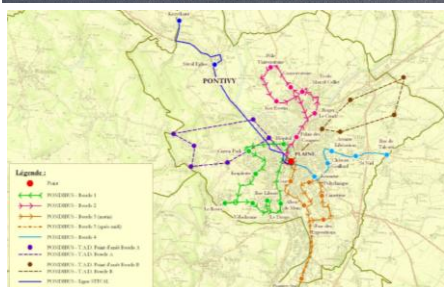
Réseau « Pondibus »

Enfin, sur la ligne ferroviaire Pontivy et Auray, la SNCF n' a maintenu que le transport de fret qui est l' un des plus importants du Morbihan.