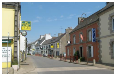
Quelques commerces (Cléguérec)

de Guéméné sur Scorff limitrophe à la commune de Séglien.