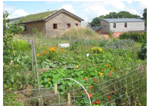
Hameau éco-citoyen (Silfiac)