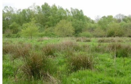
Tourbière (Silfiac-Porh Clud)