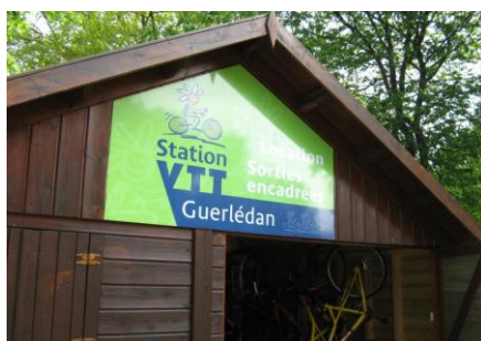
Circuits en VTT