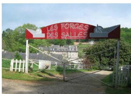
Les Forges-des-salles à Sainte Brigitte