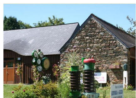
Musée de l'électricité à Saint Aignan