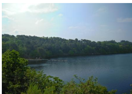
Lac de Guerlédan