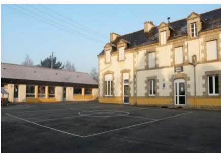
Ecole primaire (Guénin)

Melrand, la commune a longtemps profité de l' attractivité de sa situation pour attirer des nouveaux habitants (britanniques) pour rénover son patrimoine d' habitat ancien – phénomène qui semble s' estomper.