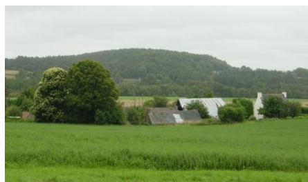
Montagnes noires (Melrand)