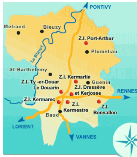
Carte des zones industrielles et artisanale du canton de Baud ( www.pluméliau.net )

qui l' entourent. Les autres communes comme Saint Barthélémy, Melrand et Guénin ont quelques commerces de proximité (épicerie, boulangerie...) qui tentent de se maintenir.