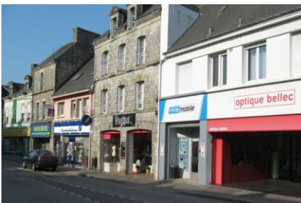
Le centre ville de Baud regroupe 87 commerces