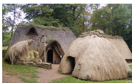
Village de l'an Mil site archéologique de " Lann Gouh (Melrand)