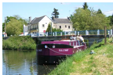
Saint Nicolas des Eaux (Pluméliau)