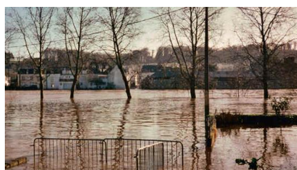
Inondation de déc. 2000 et janv.2001

Cette croissance est stimulée par l'aire d'attraction de Vannes/Auray qui se trouve à moins de 40 km (RN 24). Quant à