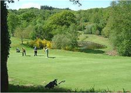
Golf de Rimaison