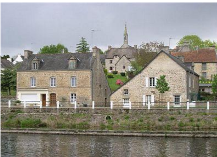
Saint Nicolas des Eaux (Pluméliau)